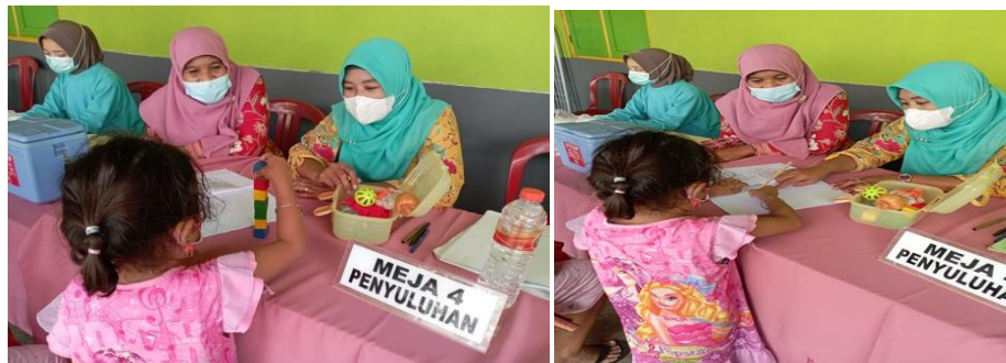
Gb3. Pendampingan Deteksi Perkembangan anak di posyandu