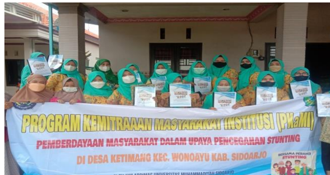
Gb 2. Kader Setelah kegiatan Pelatihan