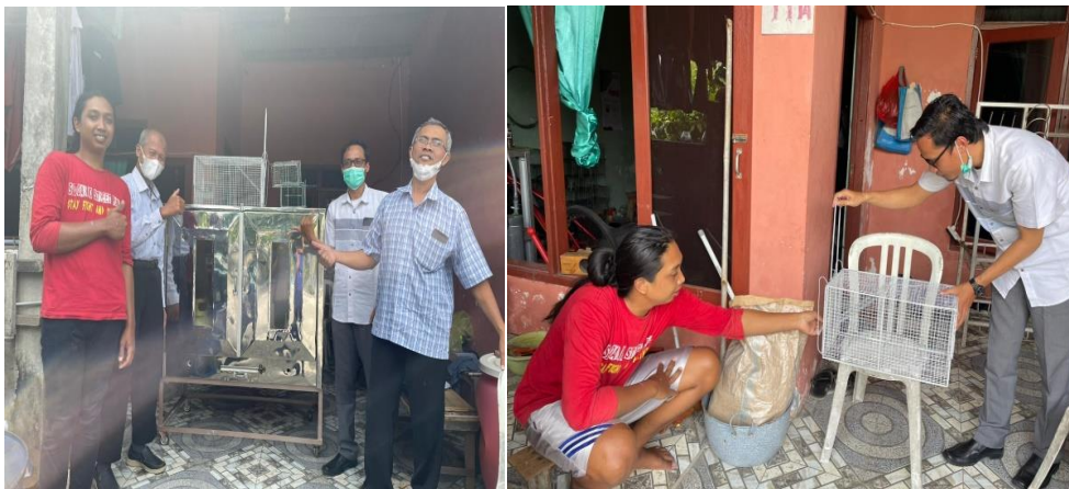
Gambar 4 Memberikan edukasi manajemen keuangan dan pemasaran

Pada saat pandemi Covid-19 mengalami penurunan yang sangat drastis, karena mayoritas pelanggan mengutamakan kebutuhan pokok dan kebutuhan lainnya ditangguhkan. Dalam program pengabdian masyarakat memberikan pendampingan dengan memberikan pelatihan bidang manajemen operasional, bidang manajemen keuangan dan manajemen pemasaran, sehingga kedepannya sistem produksi, penjualan dan harga dapat bersaing. Pelatihan dan pendampingan ini akan dilakukan secara berkala untuk dapat berkembang serta dapat mengimplementasikan manajemen operasional, manajemen keuangan dan manajemen pemasaran. Sejalan dengan penelitian Setya Mulyawan, (2015). Untuk mengelola keuangan perusahaan dimulai dari: perencanaan, penganggaran, pemeriksaan, pengelolaan, pengendalian, pencarian dan penyimpanan. Menurut Philip Kotler dan Gray Armstrong (2008; 62) bauran pemasaran adalah kumpulan alat pemasaran taktis terkendali yang dipadukan perusahaan untuk menghasilkan respon yang diinginkan di pasar sasaran.