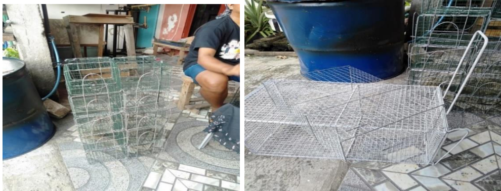
Gambar 2 Hasil produksi

Pada saat pandemi Covid-19 mengalami penurunan yang sangat drastis, karena mayoritas pelanggan mengutamakan kebutuhan pokok dan kebutuhan lainnya ditangguhkan. Dalam program pengabdian masyarakat memberikan pendampingan dengan memberikan pelatihan bidang manajemen operasional, bidang manajemen keuangan dan manajemen pemasaran, sehingga kedepannya sistem produksi, penjualan dan harga dapat bersaing. Pelatihan dan pendampingan ini akan dilakukan secara berkala untuk dapat berkembang serta dapat mengimplementasikan manajemen operasional, manajemen keuangan dan manajemen pemasaran. Sejalan dengan penelitian Setya Mulyawan, (2015). Untuk mengelola keuangan perusahaan dimulai dari: perencanaan, penganggaran, pemeriksaan, pengelolaan, pengendalian, pencarian dan penyimpanan. Menurut Philip Kotler dan Gray Armstrong (2008; 62) bauran pemasaran adalah kumpulan alat pemasaran taktis terkendali yang dipadukan perusahaan untuk menghasilkan respon yang diinginkan di pasar sasaran.