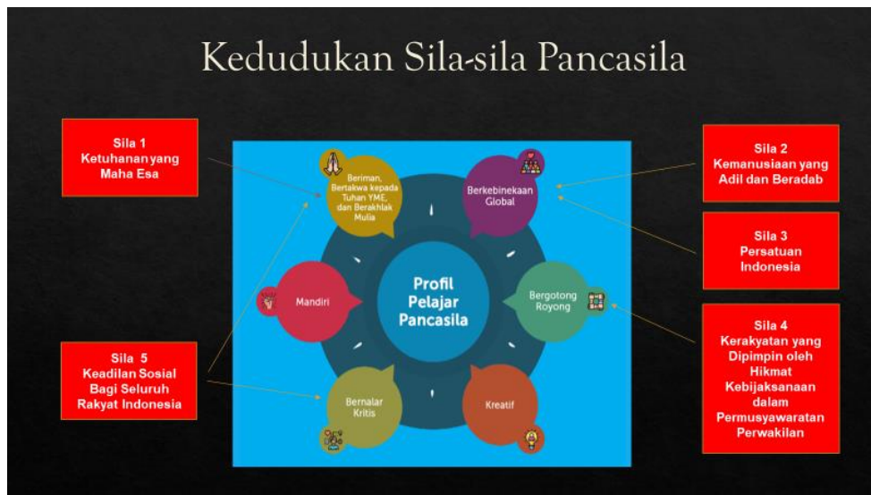
Gambar 3. Kedudukan Sila-sila Pancasila dalam Profil Pelajar Pancasila

empat elemen kunci (memperoleh dan memproses informasi dan gagasan; menganalisis dan mengevaluasi penalaran; merefleksikan pemikiran dan proses berpikir; dan mengambil keputusan); dan (f) Kreatif, yang memiliki dua elemen kunci (menghasilkan gagasan yang orisinal; dan menghasilkan karya dan tindakan yang orisinal) [11].