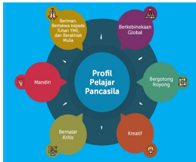
Gambar 2. Profil Pelajar Pancasila

Penerapan nilai-nilai sila Pancasila tentu saja sejalan lurus dengan cerminan Profil Pelajar Pancasila. Profil Pelajar Pancasila adalah salah satu usaha Kementerian Pendidikan dan Kebudayaan untuk meningkatkan kualitas pendidikan di Indonesia yang mengedepankan pada pembentukan karakter. Penguatan Profil Pelajar Pancasila berfokus pada penanaman karakter juga kemampuan dalam kehidupan sehari-hari melalui budaya sekolah, pembelajaran intrakurikuler maupun ekstrakurikuler, proyek penguatan Profil Pelajar Pancasila juga Budaya Kerja [10].